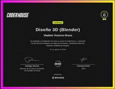
Certificado Diseño 3D (Blender) Top 10.

Las posibilidades que entrega el mundo digital son infinitas, el 3D es una herramienta que abre nuevos horizontes al momento de plasmar una idea. Desde el modelado low poly hasta el render, ya sea un personaje de videojuego, un escenario virtual o un modelo de producto para fines comerciales.